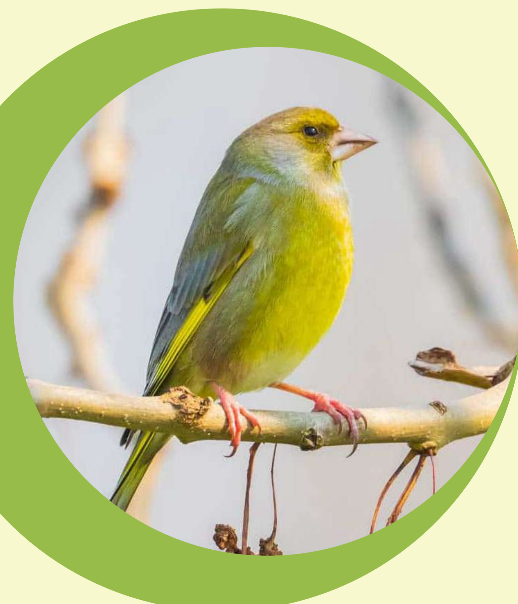
Le verdier d'Europe Chloris chloris